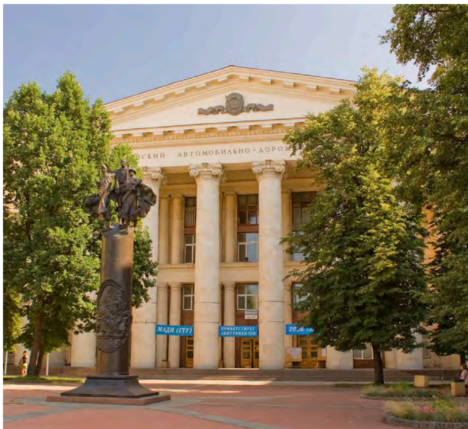
Московский автомобильно-дорожный государственный технический университет