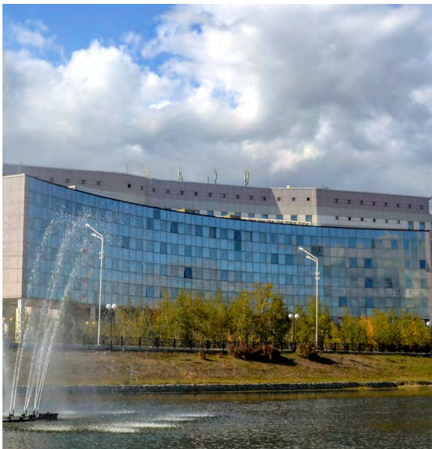
Северо-Восточный федеральный университет имени М.К. Аммосова Корпус факультетов естественных наук, 2013 год