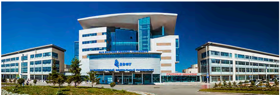
Дальневосточный федеральный университет