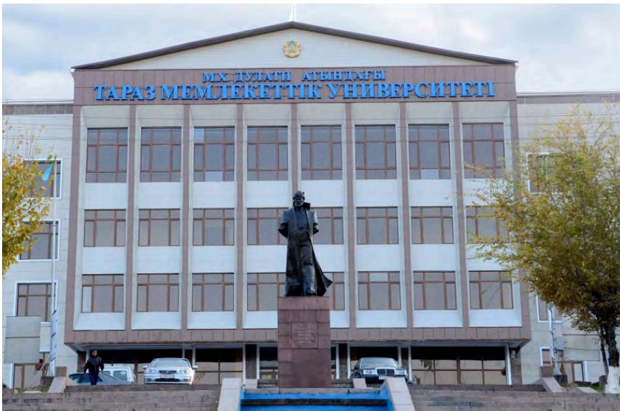
Таразский региональный университет имени М.Х. Дулати