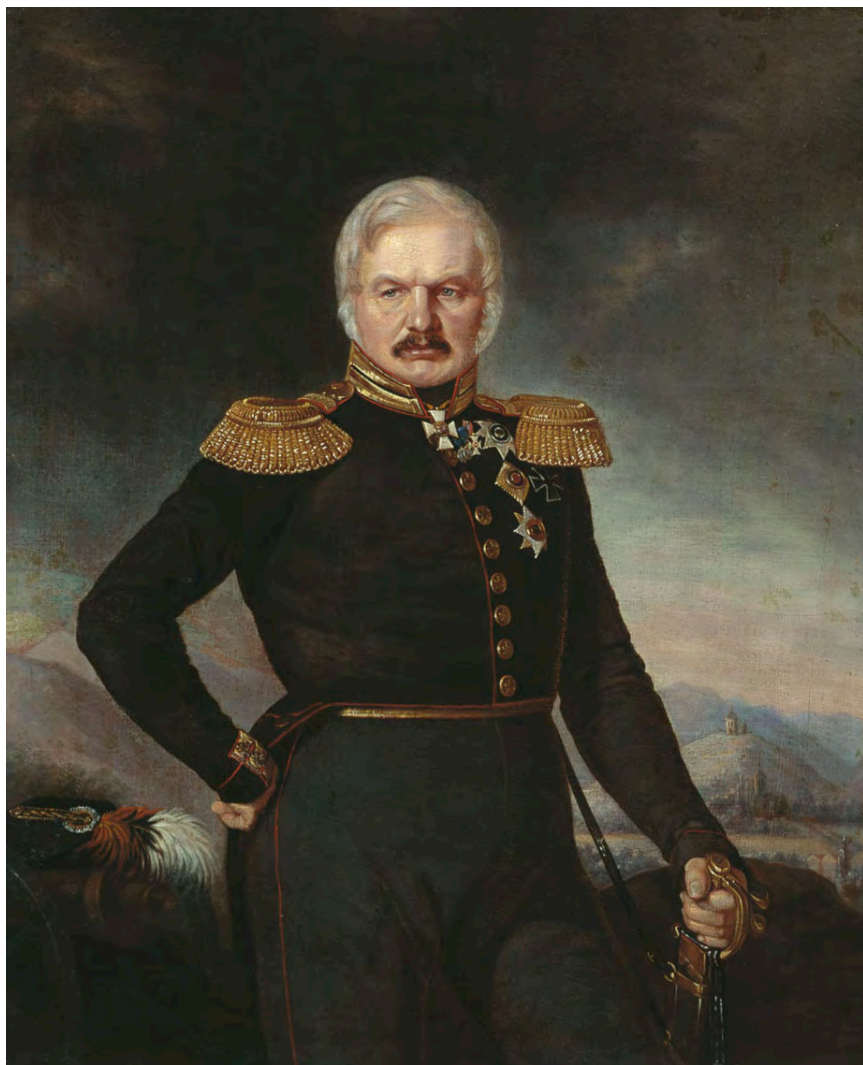
Грамоты на ордена генерала А.П. Ермолова

Генерал от артиллерии А.П. Ермолов — член Государственного Совета, почетный академик Императорской Академии наук, действительный член Российской Академии, почетный член Императорского Московского Университета. Портрет работы П.З. Захарова-Чеченца, ок. 1843 г.