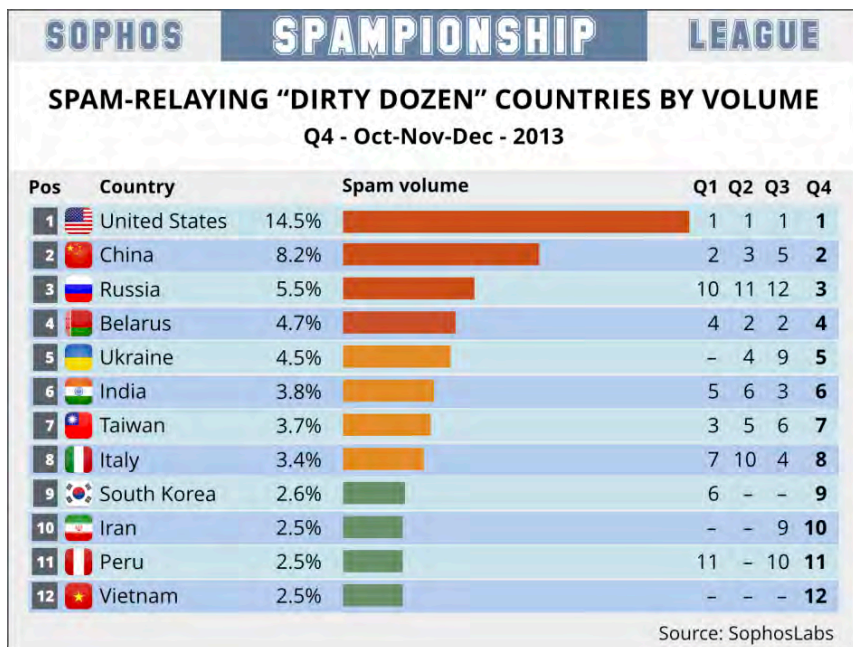
Таблица 1. Страны-лидеры в области распространения спама.

спам, содержащий сообщения политического, агитационного или религиозного характера; идиотический спам, содержащий откровенно бессмысленные сообщения, которые содержат просто набор нецензурных слов и выражений — просто из хулиганства 3 .