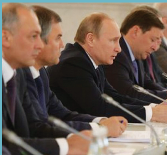
Заседание Совета по межнациональным отношениям.