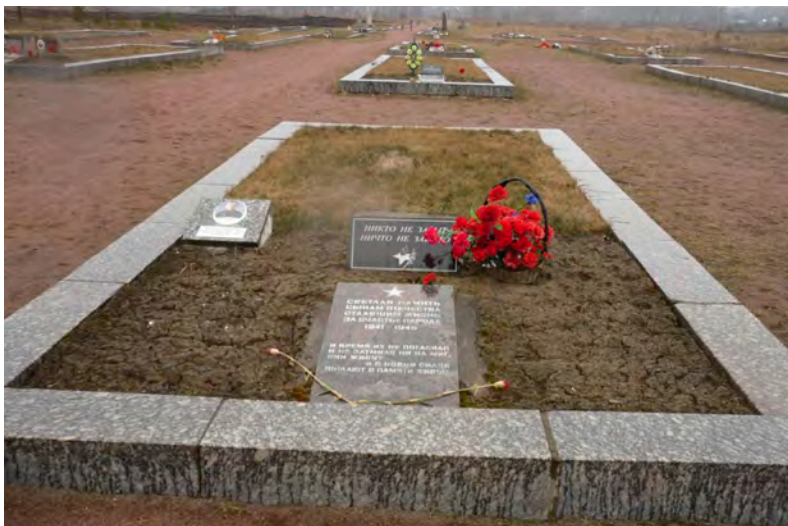
Братские могилы, в которых захоронены советские воины, защищавшие плацдарм «Невский пяточок».