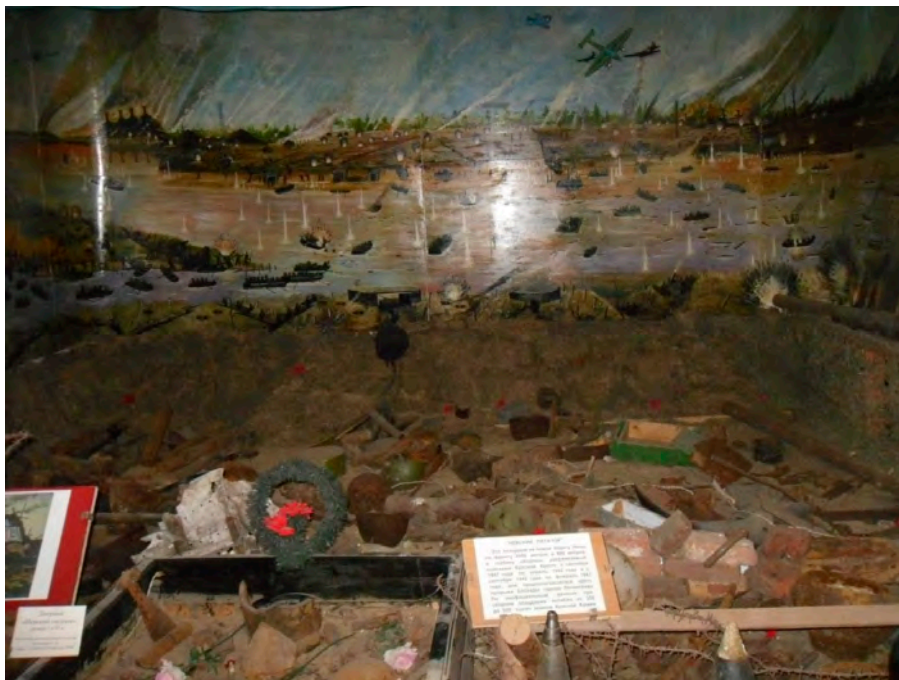
Панорама переправы через Неву на Невский плацдарм. Музей «Невский пяточок».

«Сегодня у нас опять был день тяжёлого боя, который потребовал много жертв. Если так пойдёт и дальше, то нам по-видимому придётся остаться в России».