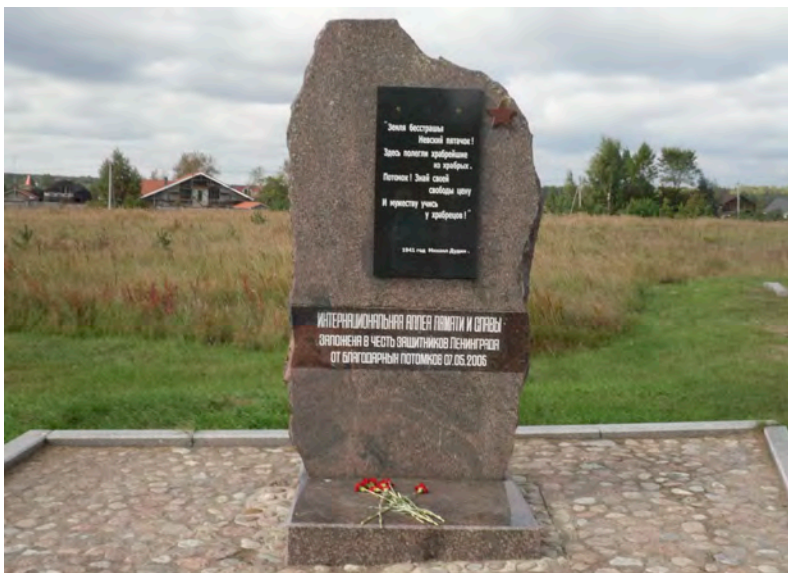
Интернациональная Аллея Памяти на плацдарме «Невский пяточок».