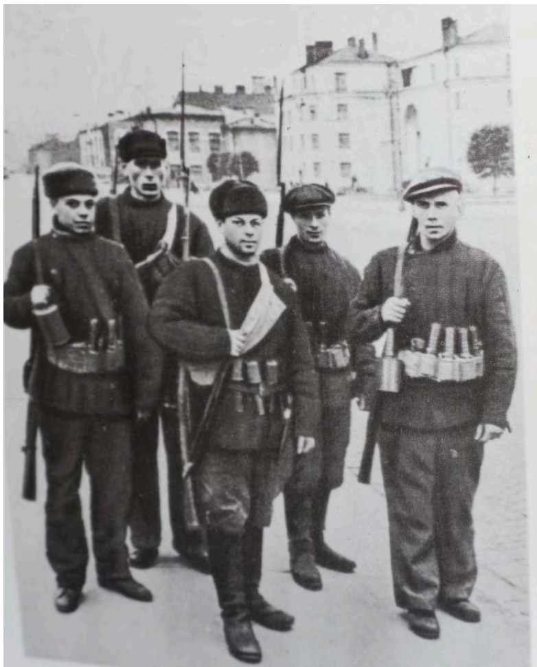
Народное ополчение – защитники Ленинграда в 1941 году.

шла из окружения. Остатки дивизии были сняты с позиций. В Ленинграде дивизия была пополнена не до комплекта, в том числе за счёт добровольцев, представителей интеллигенции Ленинграда, учёных. 18.10.1941 года 265 дивизия прибыла на берег реки Невы, в район посёлка Невская Дубровка. Затем она была переброшена на плацдарм. Участвовала в Синявинской операции 1941 года,