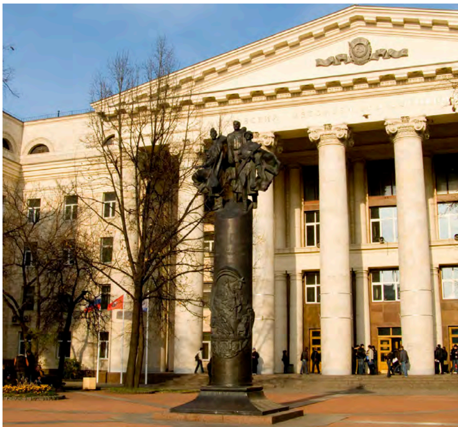
Московский автомобильно-дорожный государственный технический университет