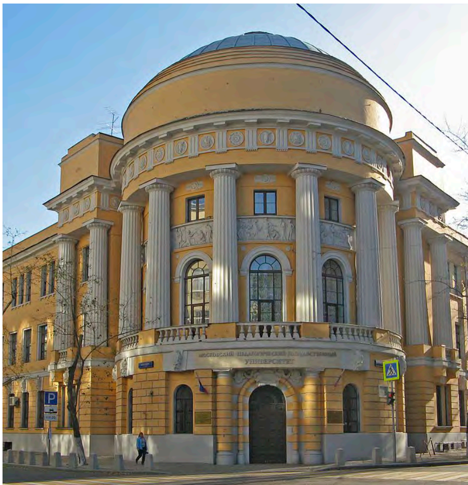
Московский государственный педагогический университет