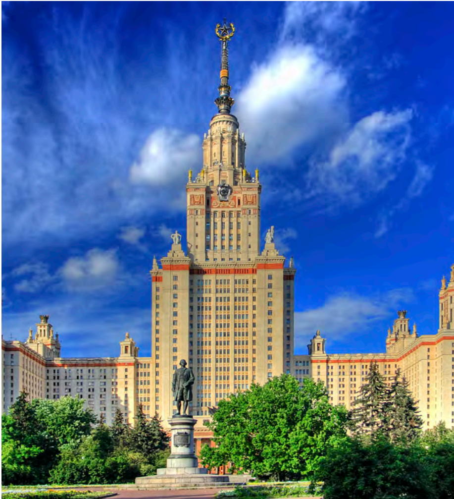
Московский государственный университет имени М.В. Ломоносова