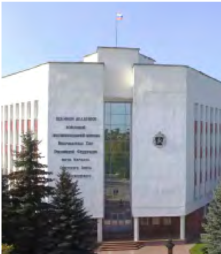
Военной академии войсковой ПВО Вооруженных Сил РФ имени маршала Советского Союза Василевского А.М.