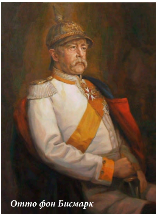
Отто фон Бисмарк