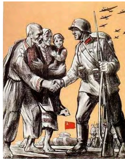
Подать руку помощи братским народам Западной Украины и Западной Белоруссии — наша священная обязанность!

Новым качеством братания стал его не индивидуальный, а коллективный характер. Во время войны родился термин «города-побратимы». Его появлению в 1944 г. способствовала акция жителей английского города Ковентри, разрушенного немецки-