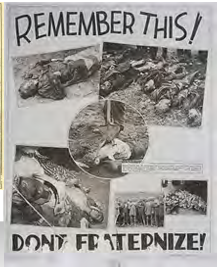
Плакат для американских солдат: «Помни это! Не братайся!»