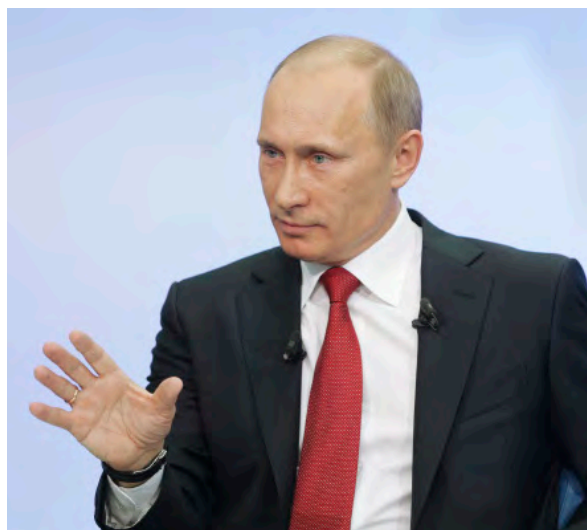
Владимир Владимирович Путин

Продолжаем публиковать статьи для Совета по международным отношениям при Президенте РФ. В данном номере журнала статья о ценностях образования и гражданском воспитании предполагает отклики научного сообщества неравнодушных граждан.