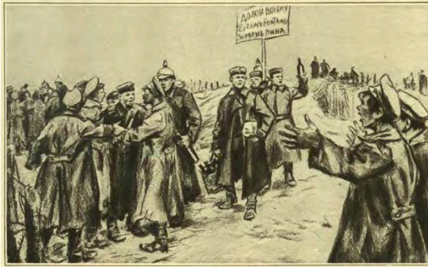
Братание во время Первой мировой войны