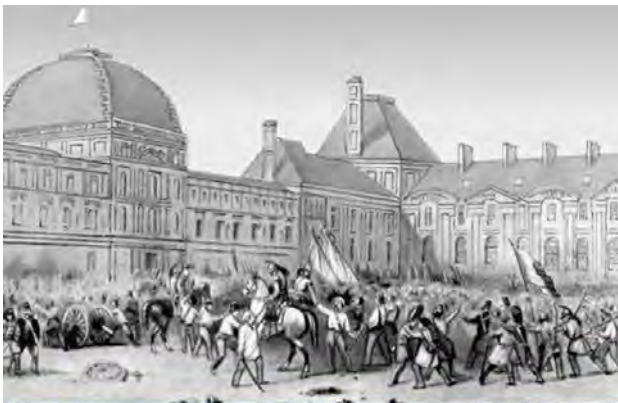
Братание солдат с восставшими у дворца Тюильри 24 февраля 1848 г.

В марте 1945 г. генерал Д. Эйзенхауэр выступил с инициативой создания нового класса заключенных, на которых формально не распространялись условия Женевской Конвенции по правам военнопленных. Он их назвал Разоруженные Силы Неприятеля (англ. Disarmed Enemy Forces (DEF)). Эйзенхауэр также был жестким противником братания между американскими войсками и немецким населением. Для американских военнослужащих в целях напоминания этого запрета был выпущен специальный плакат.