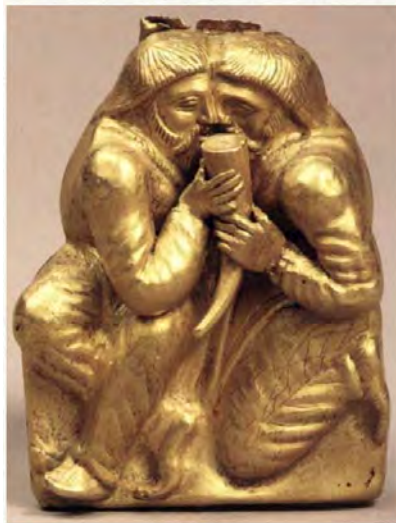
Скифское золото. Сцена воинского братания — один из обрядов-ритуалов русской воинской традиции.

Действия по заключению побратимства зависели от множества других традиций: где-то надрезали острым лезвием пальцы и слизывали друг у друга кровь, где-то достаточно было выпить из одной чаши, одеть одну рубаху. Русские при совершении