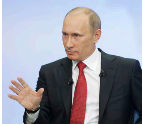
Владимир Владимирович Путин

Продолжаем публикации статей, в том числе и конкурсных ( http://etnosocium.ru/konkurs-na-luchshuyu-nauchnyuyu-i-nauchno-publitsisticheskuyu-rabotu-po-teme-molodezh-natsionalnaya-p ) для Совета по международным отношениям при Президенте РФ. Приглашаем к обсуждению новой темы: «Национальные отношения и политическая турбулентность: опыт России и международные процессы».