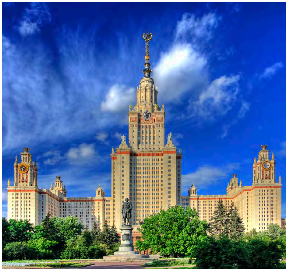
Московский государственный университет имени М.В. Ломоносова