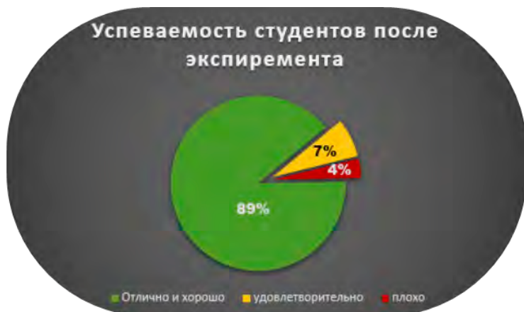
Рисунок 3. «Успеваемость студентов после эксперимента».

рактивных занятиях, показали более высокие результаты на контрольных тестах и экзаменах. Опросы среди участников показали, что интерактивное обучение способствовало более глубокому пониманию материала и повышению интереса к предмету. Кроме того, взаимодействие между студентами во время занятий способствовало созданию более дружелюбной и поддерживающей учебной атмосферы. Участники отметили, что возможность активно участвовать в процессе обучения сделала обучение более увлекательным и значимым. Таким образом, результаты эксперимента подтверждают эффективность интерактивных методов как важного инструмента в образовательном процессе.