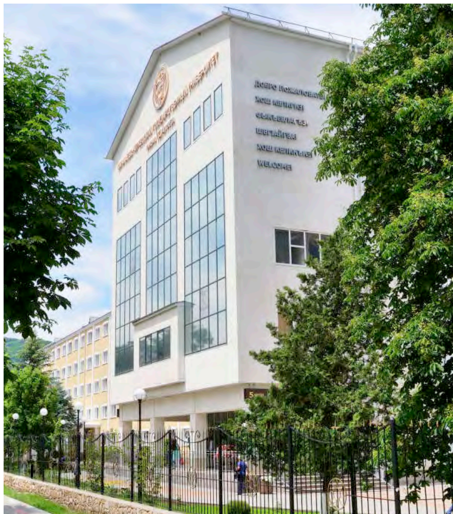
Карачаево-Черкесский государственный университет имени У.Д. Алиева