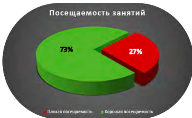
Рисунок 1. «Посещаемость занятий».

Составив диаграмму посещаемости, мы переходим к анализу успеваемости студентов, которая тесно переплетена с их регулярностью посещения занятий. Данные статистики свидетельствуют о значительном влиянии посещаемости на академические достижения. Из всей группы 73% студентов активно посещают занятия и имеют отметки «отлично» и «хорошо». Оставшиеся 27% плохо посещают занятия, в связи с этим 10% из 27% получают низкие отметки «плохо», в то время как оставшиеся 17% на грани приемлемого останавливаются на отметке «удовлетворительно» (смотреть рисунок 2). Эти цифры демонстрируют, как важна активная вовлеченность в учебный процесс, отражая взаимосвязь между усердием и успехом. С каждым посещенным занятием у студентов возникает воз-