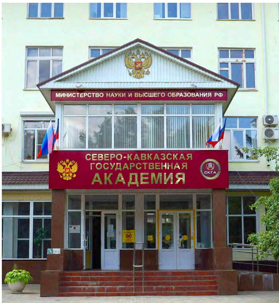
Северо-Кавказская государственная академия